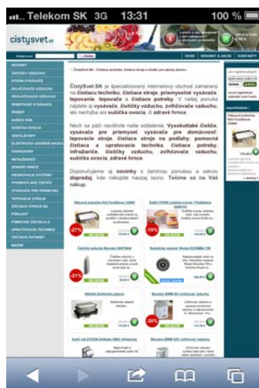
Obrázok 6. Stránka zobrazená na smartphone (Zdroj: CistySvet.SK. [online]. [cit. 2012-13-10]. Dostupné na internete: < http://cistysvet.sk/ >.)

Samozrejmosťou je, že táto stránka má aj nedostatky, ako napríklad absencia viacjazyčnej podpory, ponuka najpredávanejších a najvyhľadávanejších produktov, alebo diskusia ku každému produktu.