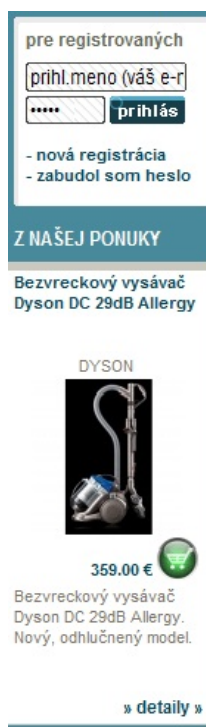
Obrázok 4. Pravá časť navigácie (Zdroj: CistySvet.SK. [online]. [cit. 2012-13-10]. Dostupné na internete: < http://cistysvet.sk/ >.)

V pravej časti navigácie (pozri Obrázok 4.) sa nachádza prihlásenie/registrácia a náhodne vybraný produkt z ponuky, ktorý sa mení pri každej vykonanej akcie na stránke.